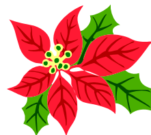
Bildtext som beskriver bilden.

När du har valt en bild, placerar du den nära artikeln. Se till att du placerar bildrubriken nära bilden.