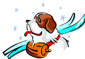
Bildtext som beskriver bilden.

När du har valt en bild, placerar du den nära artikeln. Se till att du placerar bildrubriken nära bilden.