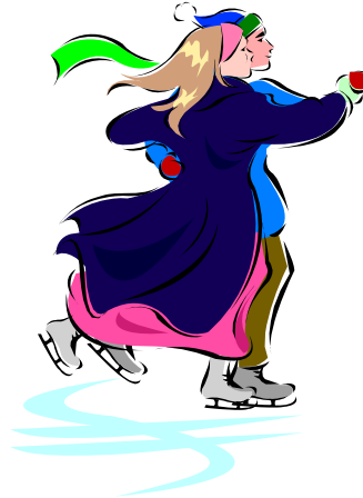
Bildtext som beskriver bilden.

En stor del av det material som du inkluderar i ett nyhetsbrev kan även användas på webbplatsen. I Microsoft Publisher kan du enkelt konvertera nyhetsbrevet till en webbpublikation. Så