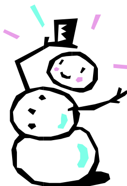
Bildtext som beskriver bilden.

En stor del av det material som du inkluderar i ett nyhetsbrev kan även användas på webbplatsen. I Microsoft Publisher kan du enkelt konvertera nyhetsbrevet till en webbpublikation. Så när du har skrivit klart nyhetsbrevet konverterar du det till en webbplats och publicerar den.