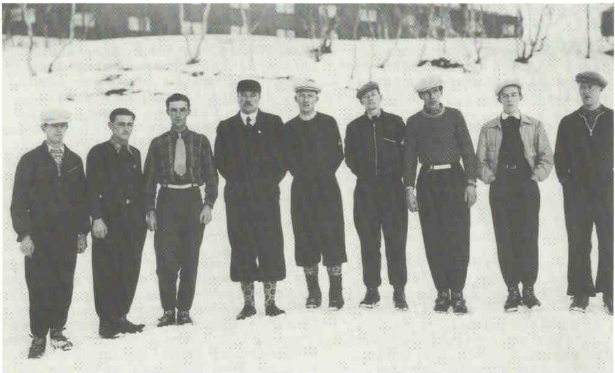
Den första svenska skidlärarexamen, 1—5 februari 1938